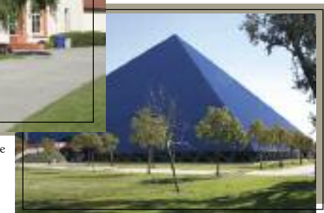
Universidad Estatal de California en Long Beach