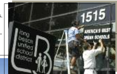
Distrito Escolar Unificado de Long Beach