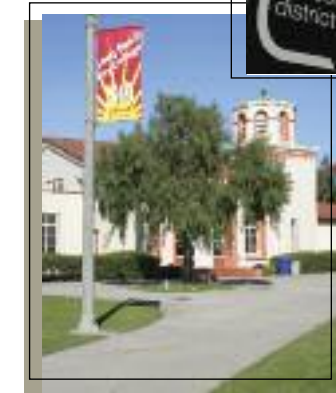
Colegio Comunitario de Long Beach