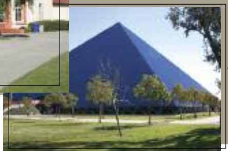
Universidad Estatal de California en Long Beach